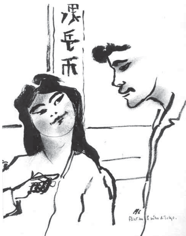
"Flirt" (métro de Tokyo)