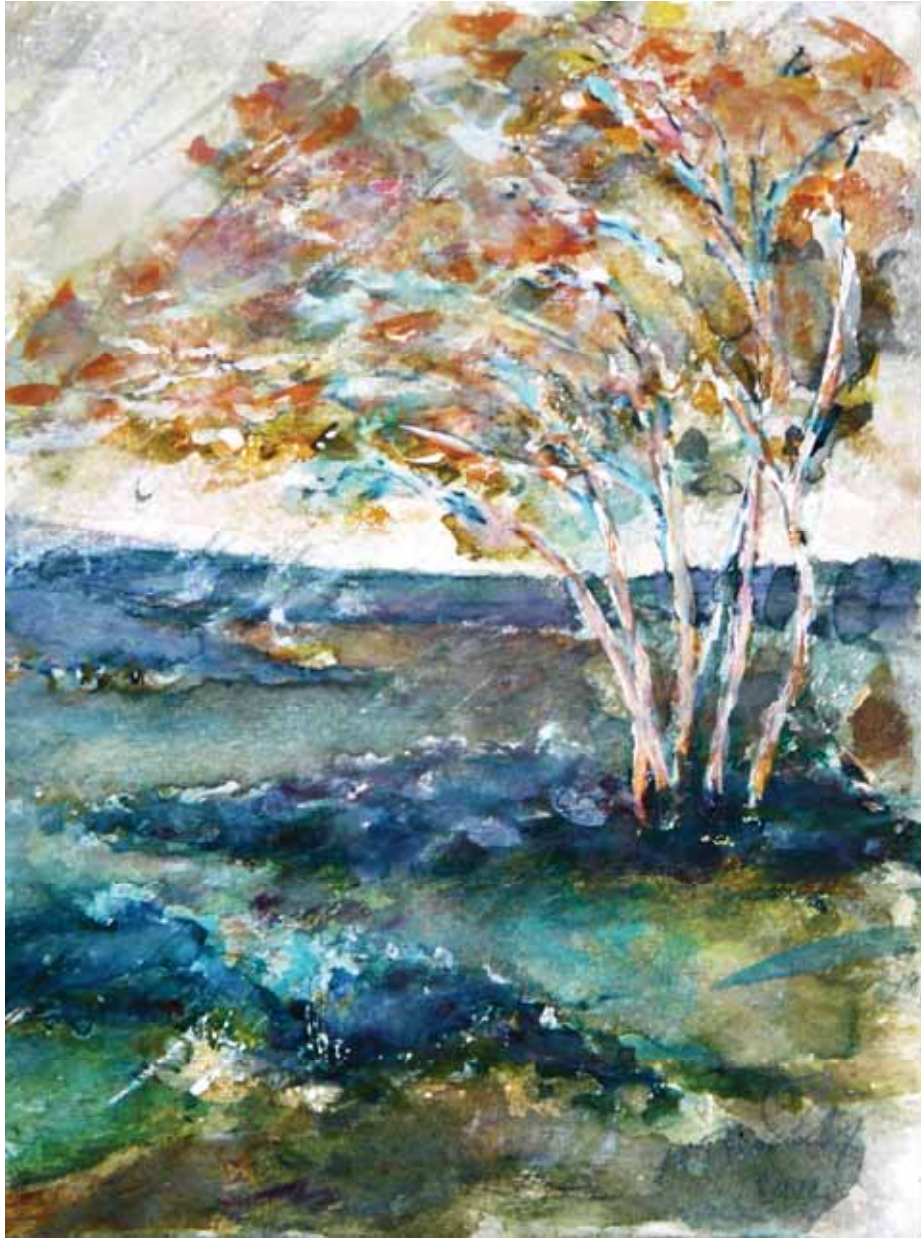
Bouleaux dans la bourrasque