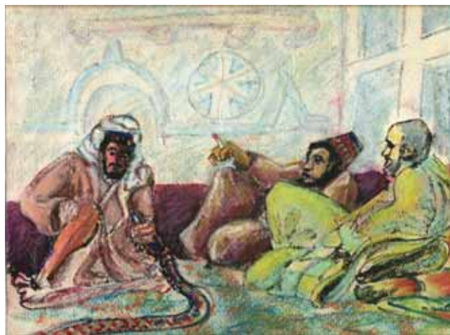
Heure du narguilé au Fondouk (Yémen)

J'aimerais aussi, chemin faisant, faire partager ce sentiment profond de connivence et de fraternité éprouvé si souvent lors de mes rencontres avec les membres de la tribu