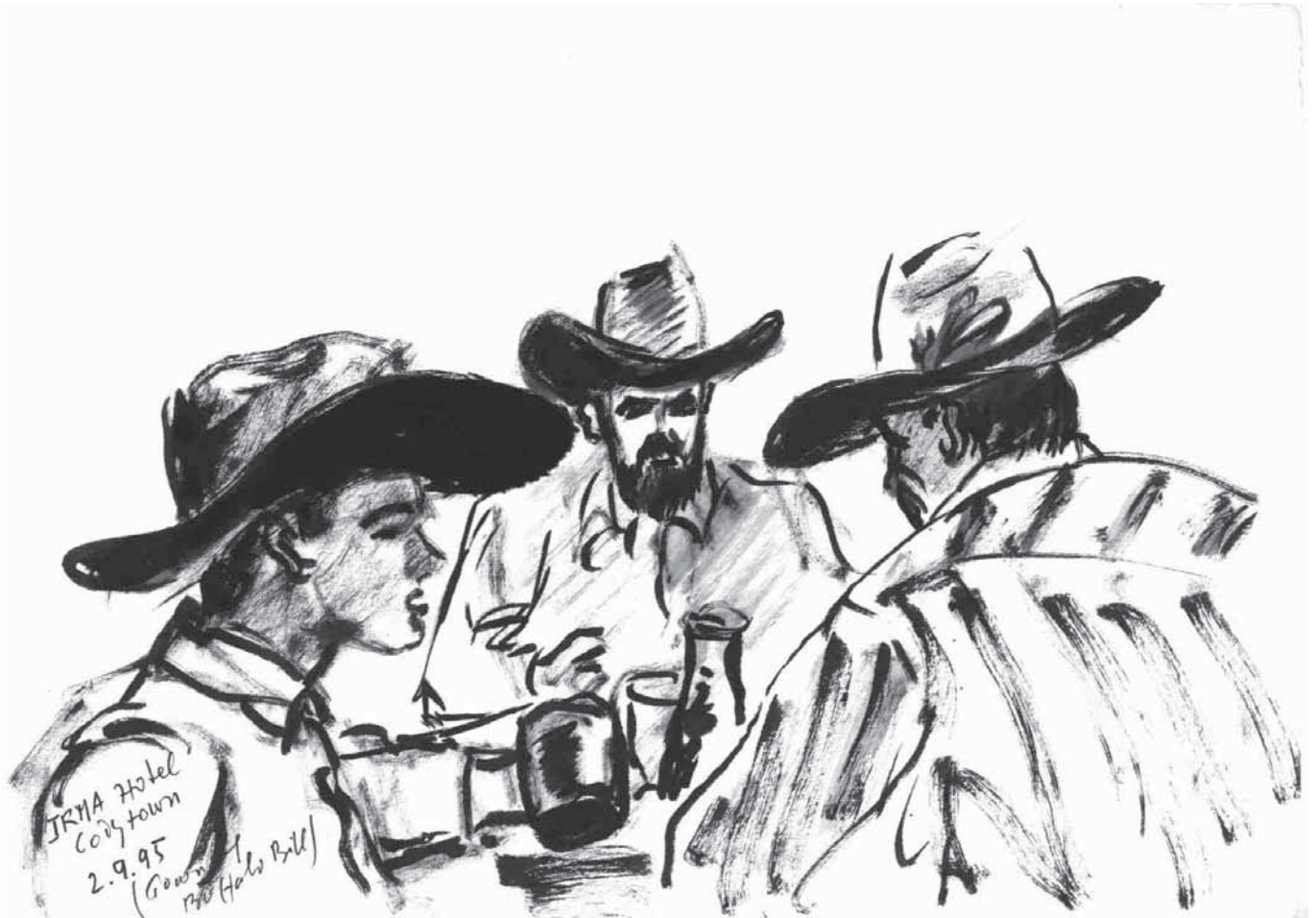
Bière entre cow boys à Cody (Rocheuses)