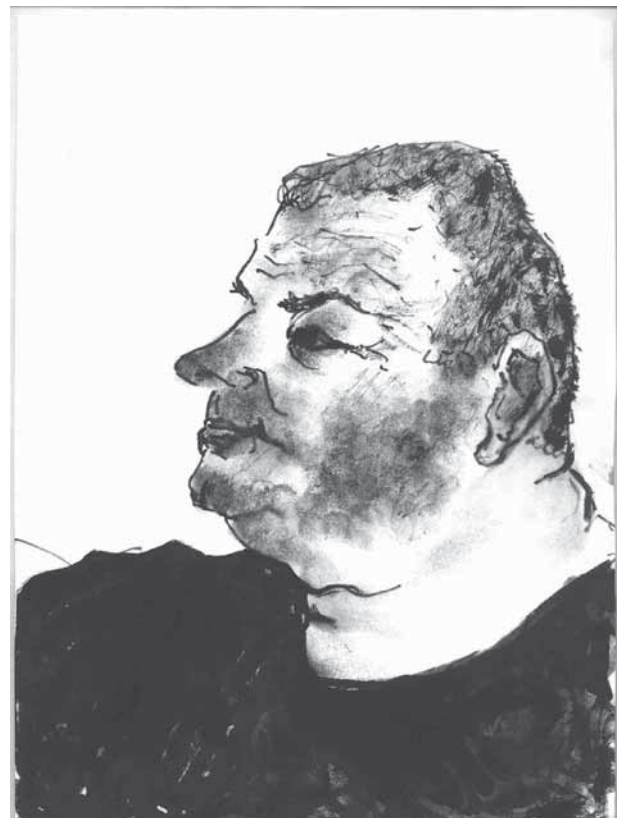
Fermier américain achetant un fusil aux enchères

Combien proches de nous tous ces hommes, nos frères, dans l'amour et la souffrance ; com-