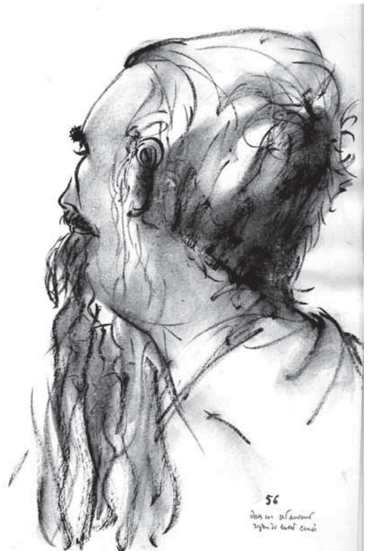
Un vieux sage chinois

Sur le chemin du retour, un vieil homme surgit sur la crête du talus; il agite les bras et dégringole la pente dans une avalanche de poussière. Il nous prend les mains, le regard suppliant et anxieux, et par gestes nous demande d'attendre. Il escalade à nouveau le talus; quelques minutes plus