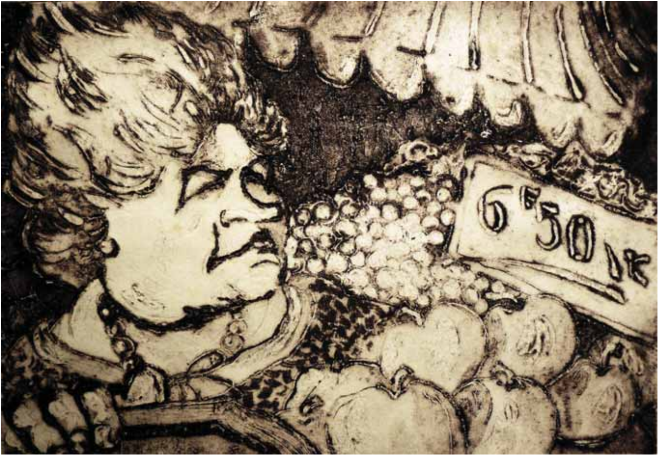
Marchande de fruits et légumes