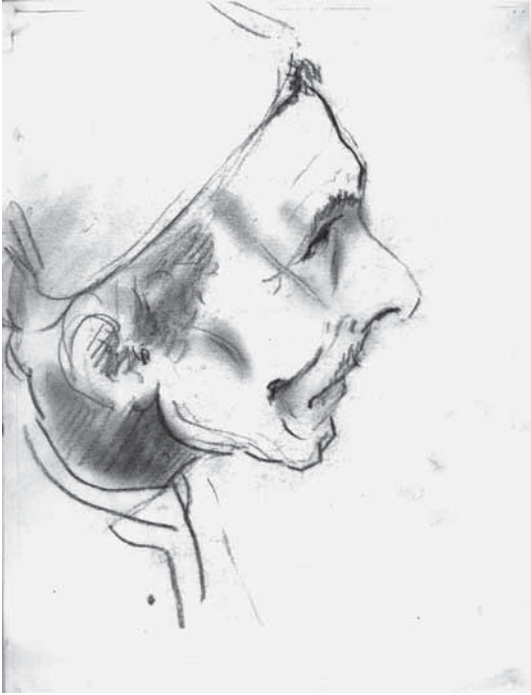
Un guide au Caire

Le ciel éclaire à peine nos tentes, lorsque soudain, au sommet des grands arbres, éclate l'appel clair et modulé des colobes, qui dans un bref élan de leurs corps noirs et blancs, tout en s'équilibrant avec leurs immenses queues immaculées, s'assemblent et disparaissent. Avant que le soleil éthiopien ne devienne implacable, nous quittons le campement ; un de mes compagnons et moi partons à la découverte, remontant le chemin qui suit à mi hauteur la berge du fleuve Omo. Deux à trois mètres plus bas, nous apercevons quelques crocodiles paresseux flottant dans le courant. Une dizaine de