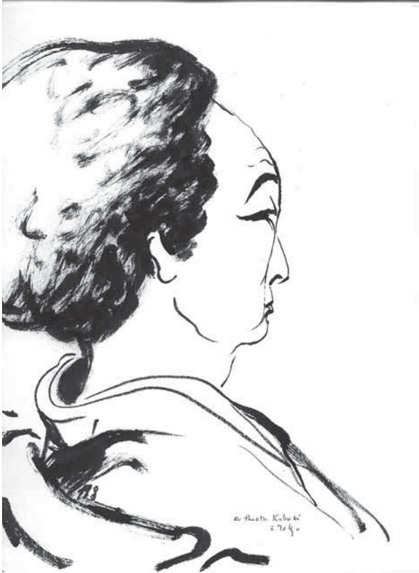
Dame japonaise au théâtre (Tokyo)

bien plus important tout ce qui nous rapproche, que ce qui nous sépare.