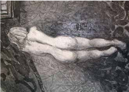
Femme égarée regardant une fenêtre éclairée