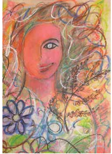
La belle infirmière

Or, à certaines époques, en certains lieux, la puissance des monarques, la clarté et l'unité des motivations de leur temps, conduisirent les artistes aux sommets de leur inspiration : ils sculptèrent jusqu'aux rêves de leurs héros et de