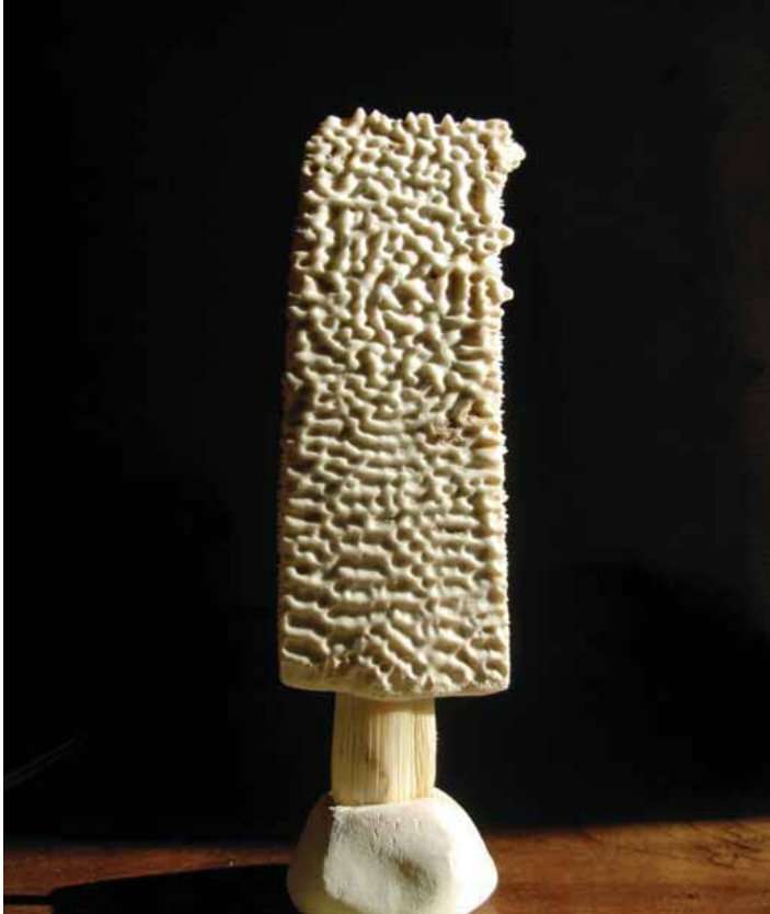
Os de tortue rappelant les formes épurées des divinités cycladiques (lac Turkana)

Parmi les multiples figures d'hommes et de divinités rencontrées au hasard des musées et des ruines, certaines que je voudrais maintenant évoquer m'auront parlé plus fort.