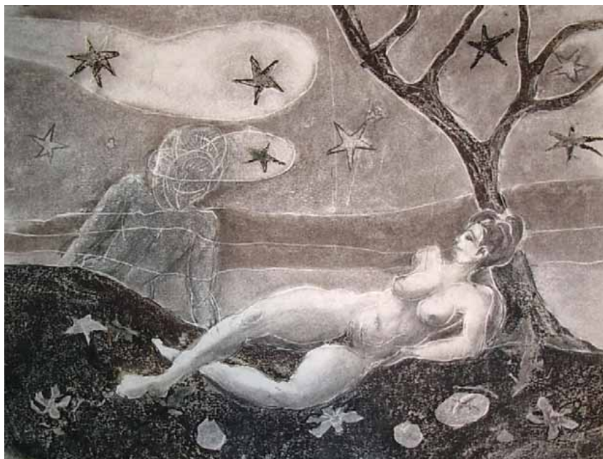
Femme rêvant sous les étoiles