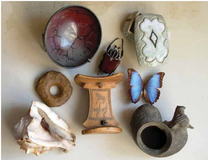
Spécimens de mes diverses collections

Ces collections ne sont, en fin de compte, que des reliques et témoins de mon existence, et avant de m'y plonger, je souhaite encore évoquer nombre de mes expériences vécues et continuer à faire quelques réflexions