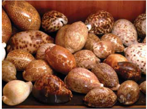
Petite collection de cowries (porcelaines)

L'Internet permet désormais d'avoir un accès instantané presque partout, à tout ce qui existe, à tout ce qui a été écrit. Mais ces facilités ne représentent qu'un pâle succédané, comparées aux émotions suscitées par les découvertes et les face à face nés du regard, du contact et enrichis de toutes les circonstances du moment.