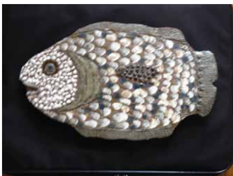
Gros poisson tacheté