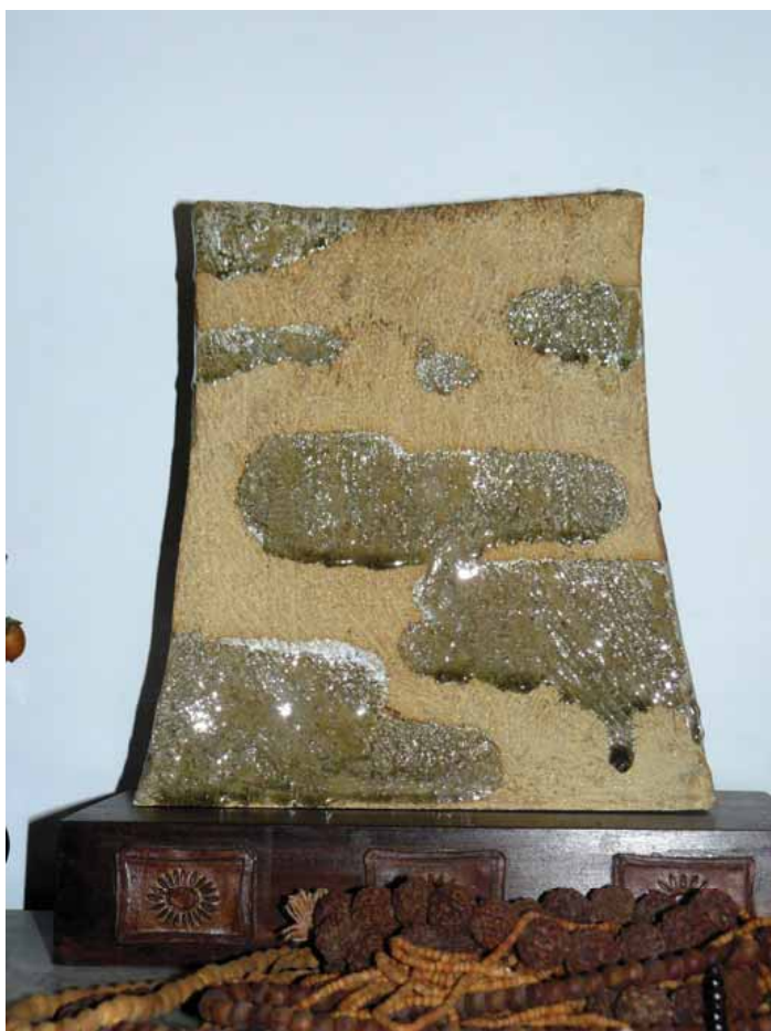
Vase aux nuages