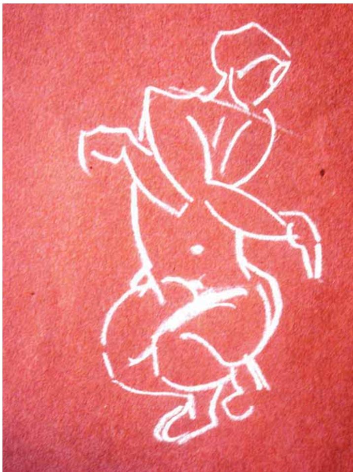
Femme à genoux les bras croisés