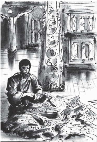
Confection d'habits royaux au palais (Bhoutan)

J'ai manqué parfois de temps mais ce pays s'est chargé de se représenter et de s'orner lui-même, car ses dieux et démons se pressent sur les murs des grottes et des temples. Ce peuple nous reste proche car d'origine arienne. C'est peut-être une chance pour nous, car l'Inde est un des seuls pays capable d'équilibrer dans l'avenir le géant chinois, du fait de sa population et son niveau culturel.