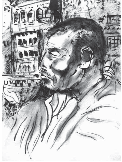
Moine à Paro (Bhoutan)

culture, et sa spiritualité (à part les zones nord est et nord ouest, musulmanes, qui s'en sont séparées). L'Inde a été et reste éminente dans les domaines de la philosophie, de la poésie, de la littérature, de la danse et de la musique, des tissages précieux et de la sculpture. L'Inde est un pays profondément religieux, où se côtoient le bouddhisme et l'hindouisme, et qui malheureusement s'accroche à un système de castes, allant des brahmanes aux intouchables.