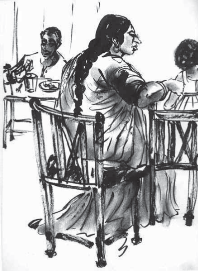
Dans un restaurant indien