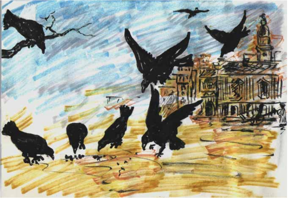
Corbeaux à Shrimagar (beauté et détritius mêlés)