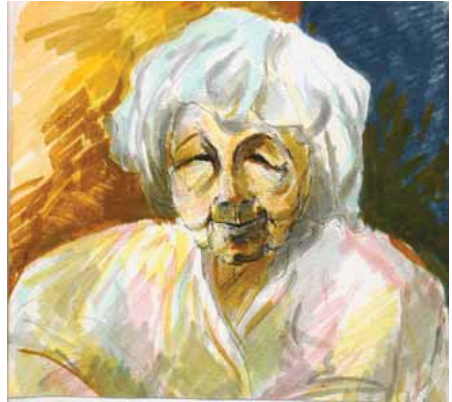
Vieille femme au marché (Terengganu )

res. Les îles qui longent la côte sont entourées de fonds coralliens qui sont parmi les plus beaux. C'est dans ce pays que se construisent encore des jonques en bois précieux aussi belles que nos plus beaux meubles.