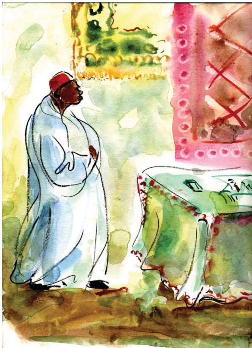
Un voyageur égyptien de présente aux douaniers libyens