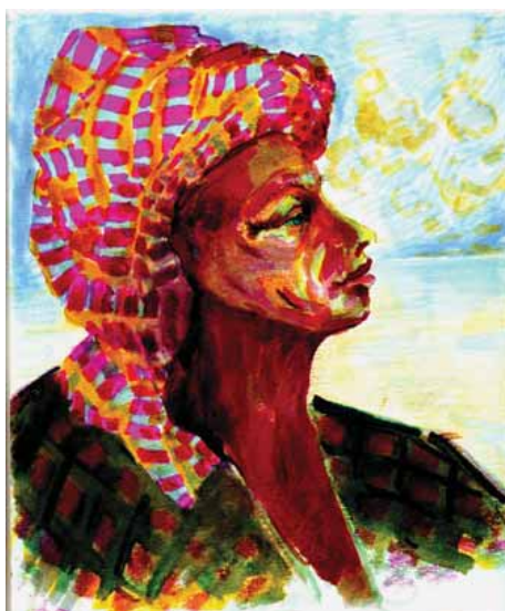
Un fier marin (ou pirate...) malais

Ce pays semi tropical s'allonge entre ses deux côtes est et ouest, il est peuplé moitié de chinois, moitié de malais musulmans. La population vit de pêche et de plantations d'hévéas et de palmiers à huile. Le centre du pays est encore occupé par la jungle, dans laquelle se cachent de rares tigres et rhinocéros. Elle pullule aussi de sangsues et de beaux papillons. Les malais sont très conviviaux et vous invitent facilement à participer à leurs fêtes.