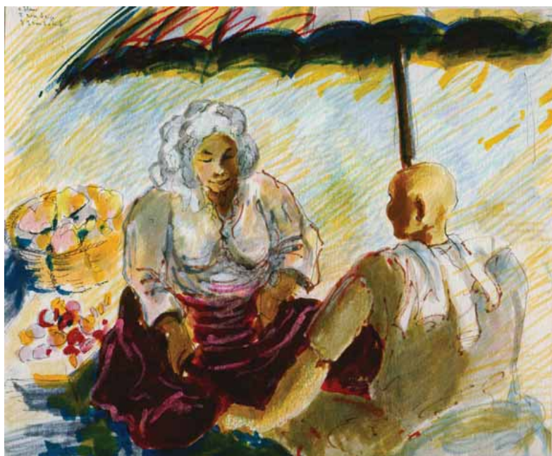
Marché de Kuala Terengganu