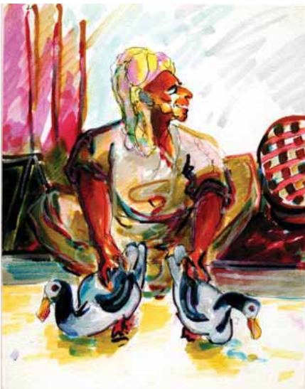
Marchand de canards à Kuala Terengganu