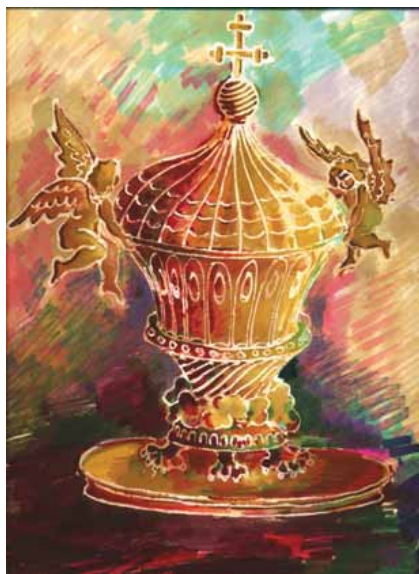
Ciboire russe imaginaire