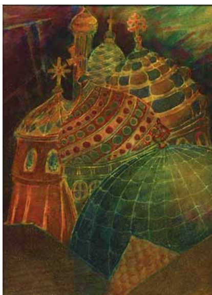
L'église de la place Rouge