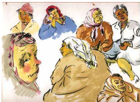
Sortie de l'église (Saint Petersburg)

La dévotion profonde de ce peuple si doué n'est égalée que par son goût pour la fête et son patriotisme.