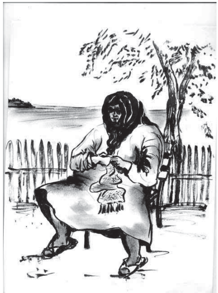
Femme turque reprisant des chaussettes