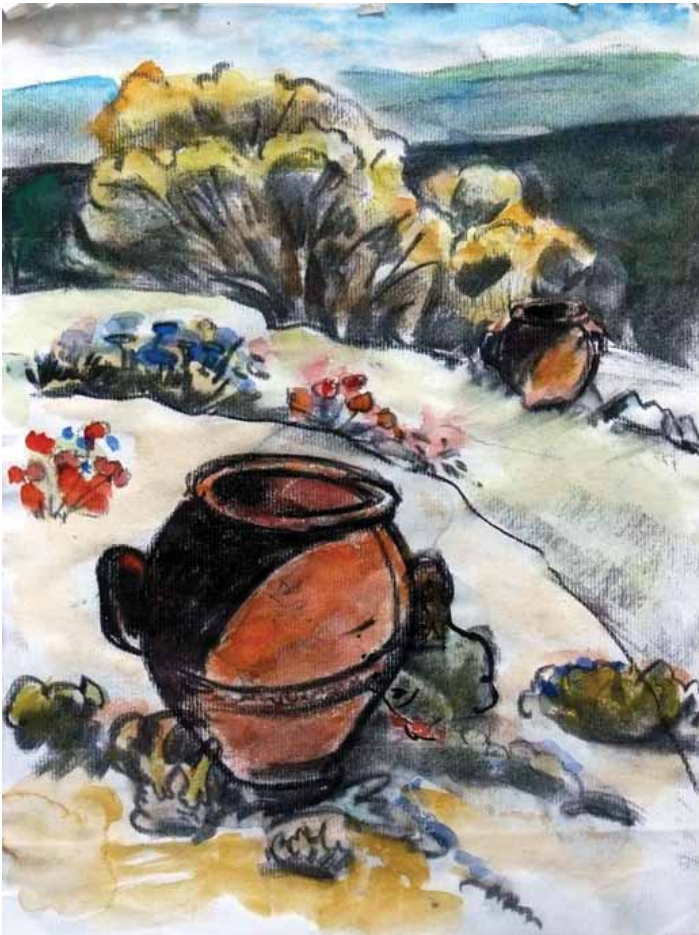
Paysage toscan et grand vase de grès