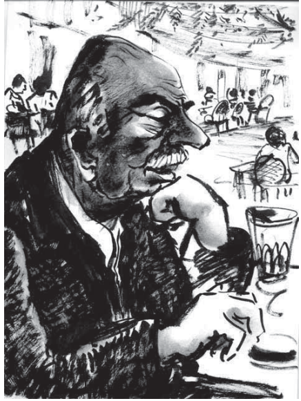
Homme d'affaires turc

Les vues qu'on découvre sur le Bosphore, soit d'une rive, soit de l'autre, sont aussi belles que des rêves. Le peuple turc, dur, courageux et fanatique, devient hélas un foyer d'affrontements des extrémismes religieux, du laïcisme, des islamismes, des communautés kurdes ou chrétiennes. La Turquie a un passé trop prestigieux, ses empereurs et sultans ont construit des empires trop immenses, pour que cette nation importante n'en garde le souvenir et les ambitions. Les turcs sont trop nombreux pour ne pas vouloir tenir une place substantielle dans le monde; mais ils sont aussi trop divisés entre eux pour qu'ils sachent et que nous puissions savoir où ils vont.