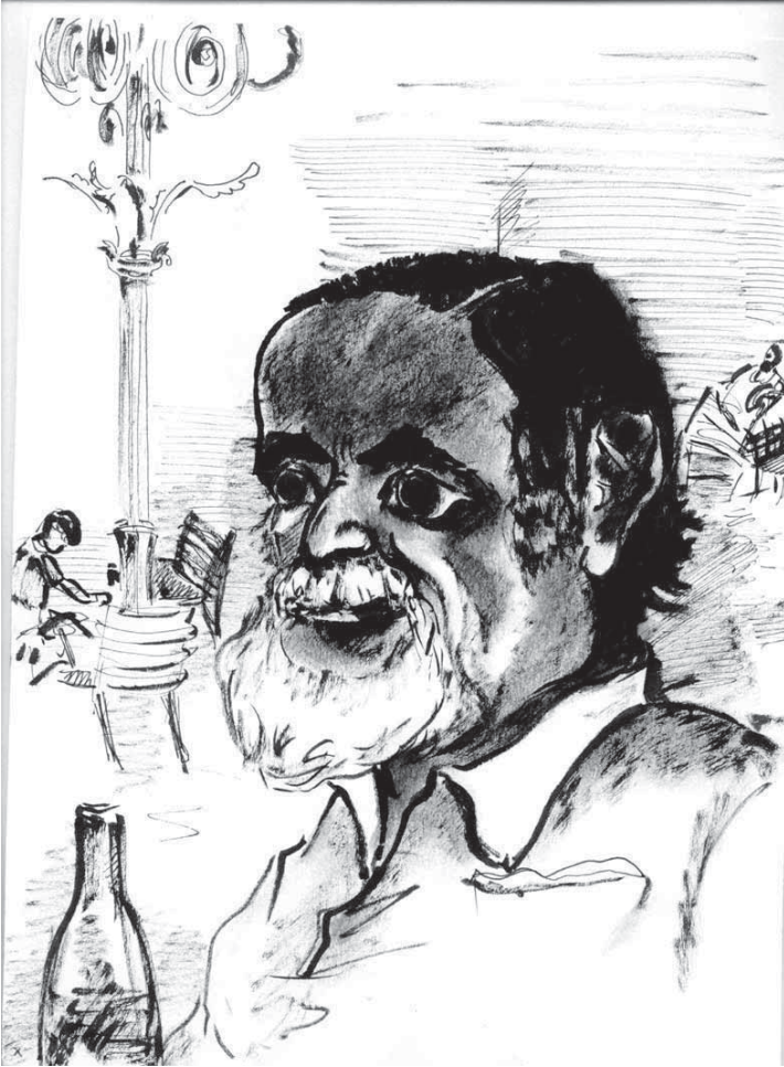
Turc au café