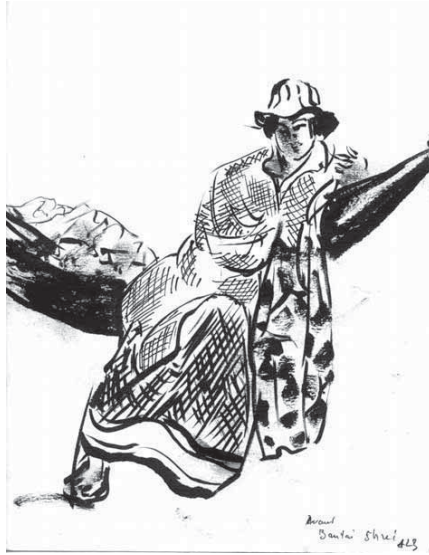
Jeune laotienne sur un hamac

Je ne m'étendrai pas sur ces pays si fascinants du sud-est de l'Asie, dont on sent les rapports étroits autant que les différences. Toutes leurs populations, si attachantes, ont été ces dernières années secouées par des dictatures, des révolutions, des massacres et des souffrances abominables, ces peuples ne sont ni chinois, ni malais, ni japonais, ils sont à la croisée de tous ces chemins, et profondément influencés aussi par les influences hindoues et le bouddhisme venu de l'Inde. Ils étaient encore, voici peu d'années, des royaumes, des provinces ou des colonies. Quand on les visitait, on y ressentait un bonheur paisible. Les femmes y sont toujours belles et gracieuses, au Vietnam surtout et au Cambodge aussi, l'influence française est encore perceptible. Il me semble pourtant qu'en dépit des horreurs subies, on ressent encore dans la rue une certaine bonne humeur. Certains de ces pays, notamment le Viêt-Nam et aussi le Cambodge comptaient nombre d'intellectuels et de lettrés de haut niveau, généralement formés en France. Ce sont là mes souvenirs un peu mêlés. J'ai gardé par exemple l'image de jeunes filles parcourant Saïgon à bicyclette, sous