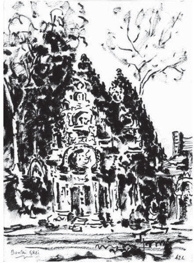
Temple de Banteay Srei

leurs grands chapeaux coniques. Leur grâce n'aurait pas détonné à Paris et était à mes yeux le résultat d'une des fusions les plus réussies entre l'Orient et l'Occident. Mais ce qu'il faut retenir de ces pays, c'est qu'ils ont vécu de grandes civilisations, parmi les plus raffinées. C'est ainsi qu'à Angkor et dans les temples disséminés dans la forêt se trouvent des architectures et des bas-reliefs qui sont un des sommets de l'art mondial, témoins à la fois de la spiritualité et du bonheur de vivre du sud-est asiatique.